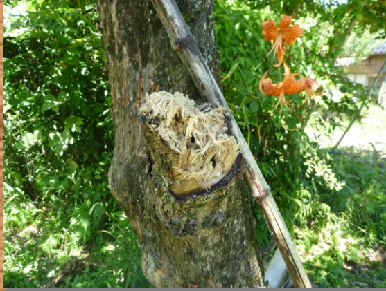
太い枝も折ってしまいます。