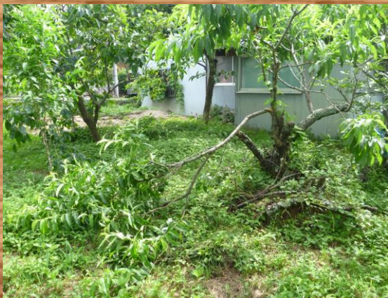
クマに折られてしまった果樹。