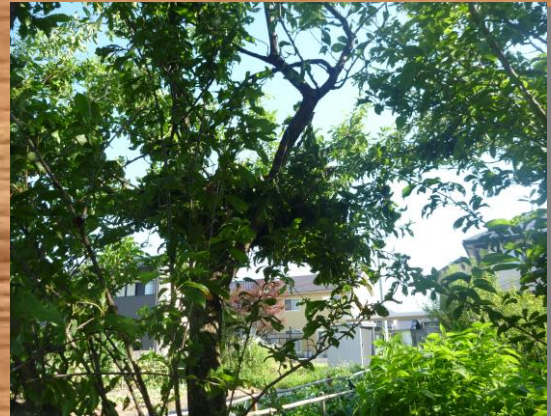
クマ棚。木に登り、木の実などを食べます。