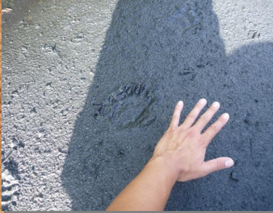
人間の大人の手の大きさ程あります。

クマの形跡を見つけたら、あわてず注意しながらその場を離れ、見通しのよい安全な場所に移動してください。