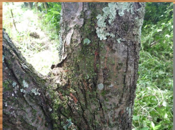
木に登る時などについた爪の跡。