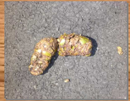
クマの糞。食べたものによって、色やにおい、性質がちがいます。