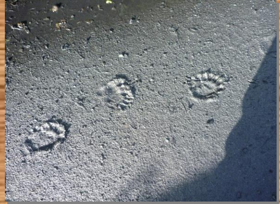
前足と後ろ足で形がちがいます。