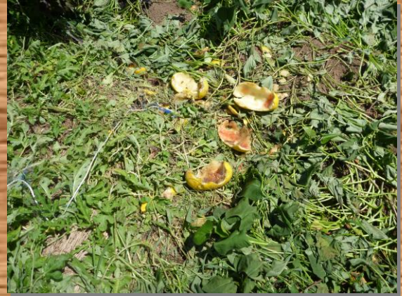
スイカを食べた跡。