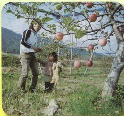
▲りんご狩り!! (アップルファームにて)