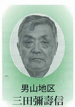
男山地区 三田彌壽信

現在、当地内でも高齢化が進み農業をする後継者がいなくなってきたり、間もなく不作付け農地が発生してきます。