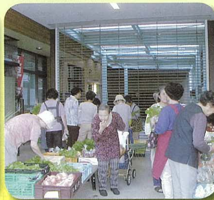
▲岩滝のふれあい朝市!!