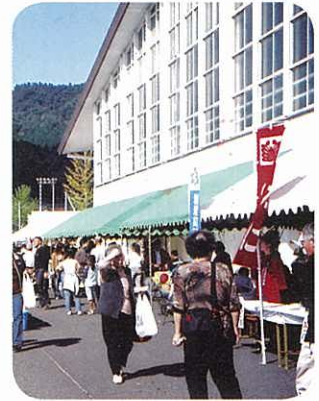
好天に恵まれたフェスティバル

秋の収穫を祝う伝統行事として従来から旧町でも、産業祭・農業祭として賑わいその歴史を重ねて参りましたがこの度、「よさのオートムフェスティバル」として岩滝体育館周辺で開催されました。当日は、秋の好天に恵まれ農産物の販売、ステージショーの他バザー・展示・イベント・