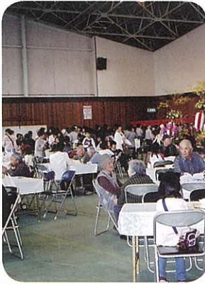
休憩所でひと休み