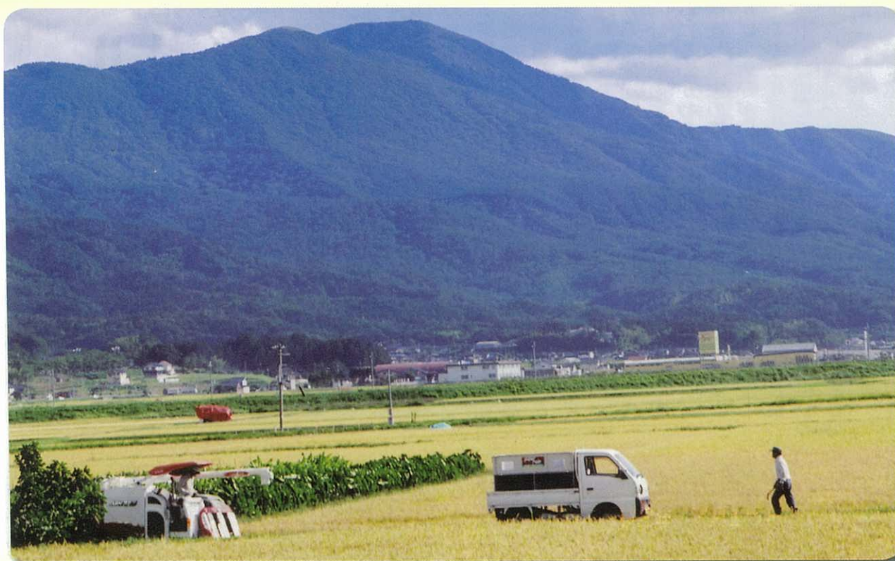
▲今年も豊作!! (JA 野田川支店から加悦谷平野を望む)