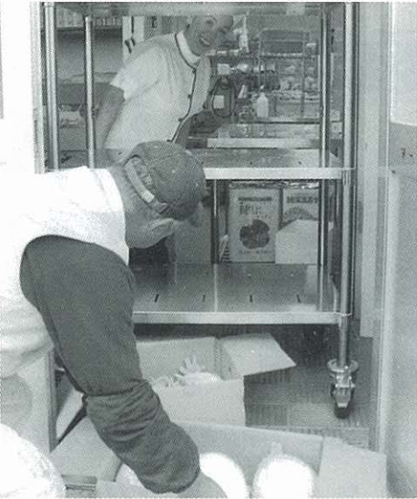
岩滝小学校へ野菜の納入

▼5年前、我々が開催しているふれあい朝市に岩滝小学校の栄養士さんが来られて、こないだ野菜があるなら給食に使いたいというお話があり、それから納入が始まりました。