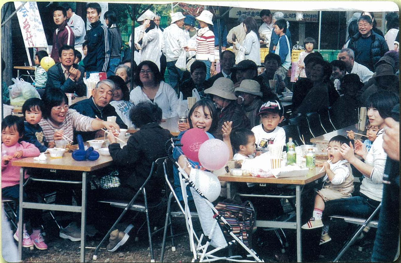
大にぎわいのリンゴ祭り ～あっぷるふぁーむにて～