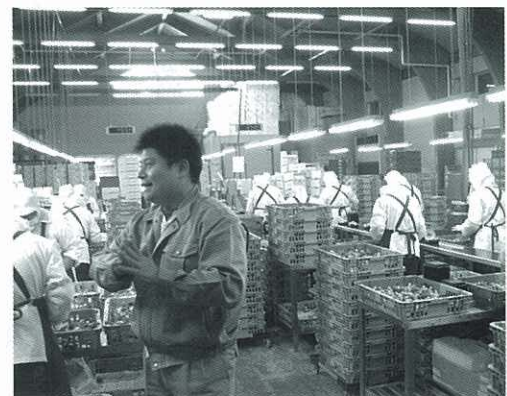
椎茸のパック詰め

ランド化を行っており、平成19年も60kg2万円の生産者単価で、会社も利益をあげておられる。