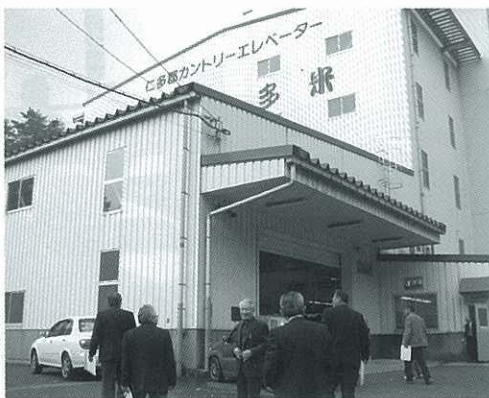
カントリーエレベーター

仁多米カントリーエレベーターは、乾燥・糶摺・精米・袋詰が可能で、第三セクターの販売会社に総べて任せ、平成10年度から『仁多米』のブ