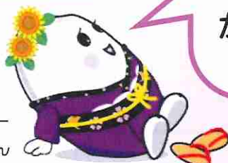
与謝野町マスコットキャラクター まめっこまいちゃん