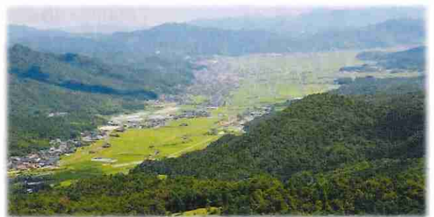
与謝野町の景観を守るためにも 農地の適正な管理を!