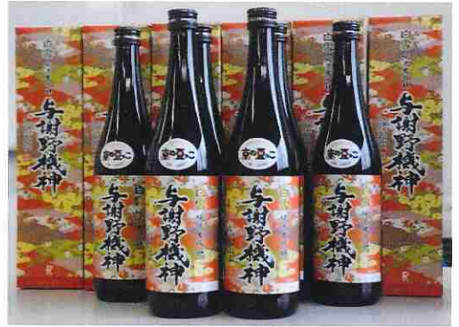
与謝野機神は720ml 瓶詰 限定1,500本(税込2,160円/本)で販売中

SOFIXは土壌中の微生物量や窒素・リン酸・カリウムなど植物の主要成分を分析し、数値に表すことによって何が足りないのかを土壌の処方箋として出すことを可能にしました。