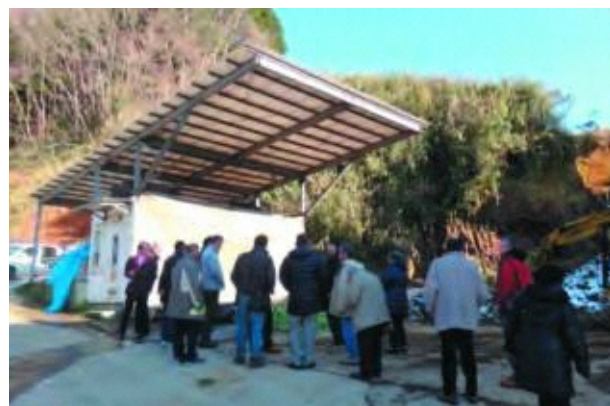
(千賀 誠八郎 委員)