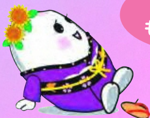
豆っこ米イメージキャラクター まめっこまいちゃん