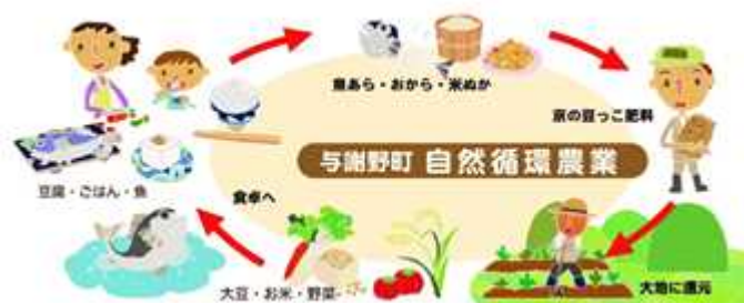
Kyou no mamekomai