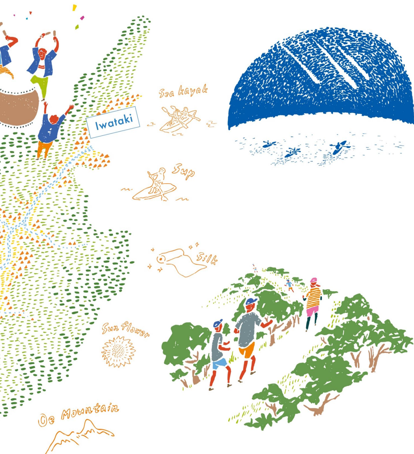
Illustration by Keisuke NISHIMURA

古くより培われた技術を磨き上げ、伝統の中に現代の新しい風を吹き込むことで、現代のものづくりとして伝統を脈々と受け継いでいます。