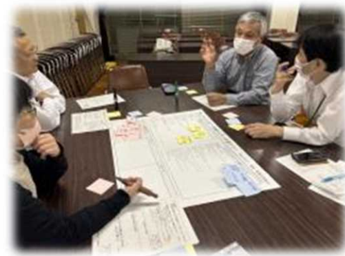
地域資源・特徴を知る・活かす