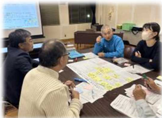
つなぐ・つながる仕組み