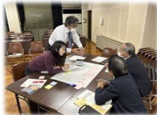
区民のやる気を支援