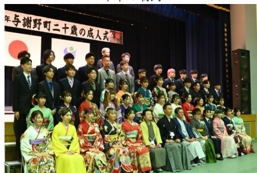
< 昨年の様子 >