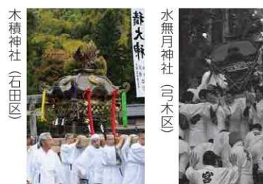
水無月神社（弓木区）

与 謝野町の氏神祭りでは6つの神社で大人の神輿の巡行（II渡御）が行われます。この神輿の渡御の時代的な変遷をみると、江戸時代の神輿渡御は天満神社（加悦・算所・後野区）、深田神社（幾地区）、板列八幡神社（男山区）の3神社ですが、明治時代以降になると板列稻荷神社（岩滝連合区）、水無月神社（弓木区）、木積神社（石田区）の3神社でも神輿の渡御が行われるようになります。その結果、旧岩滝町の4神社のすべてで神輿の渡御が行われることになりました。なお、加悦谷の南部（旧加悦町）と北部（旧野田川町）