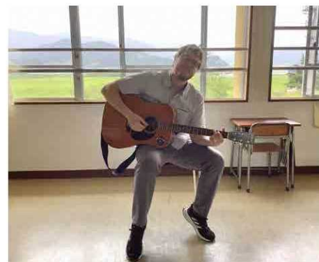
音楽は素晴らしい共通言語です！

堰板が設置されたままだと、集中豪雨によって流れてきた物が堰板付近に堆積します。堰板を設置したときは常に気象状況を確認し適切な管理をお願いします。