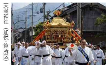
天満神社（加悦算所区）