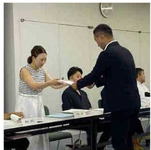
山添町長から委嘱を受ける委員(右)