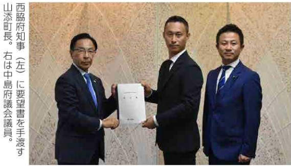
西脇府知事(左)に要望書を手渡す山添町長。右は中島府議会議長。

8月21日、京都府庁において、山添町長が中島文武京都府議会議員とともに西脇隆俊京都府知事を訪問し、令和6年度京都府予算に関する要望活動を行いました。