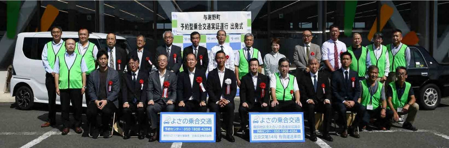
10月2日、加悦谷ショッピングプラザワイルドで開催した「与謝野町予約型乗合交通実証運行 出発式」の様子