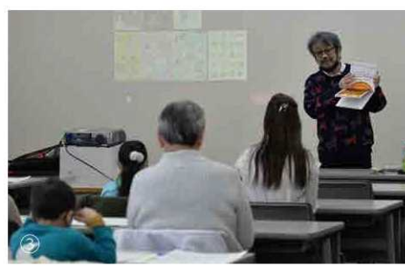
① 本館と加悦分室には、集中して読書や学習ができる机があります（写真は本館） ② ソファに座り新聞や雑誌が読めます（本館） ③ 絵本作家きむらゆういち氏をお招きし、開催した講演会（令和5年2月）

与謝野町立図書館の蔵書数は、小説や実用書、絵本などの子どもの本、雑誌やDVDなどを含めて約13万7,000点（10月末現在）あります。これから寒くなるにつれておうち時間が長くなります。図書館をもっと便利に使ってみませんか？