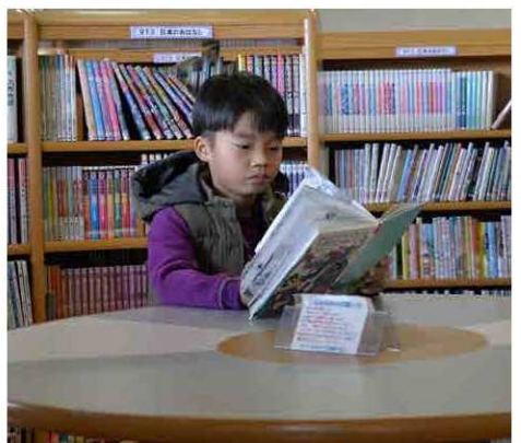
子どもたちに人気の本や絵本がそろっています

京都府北部の7市町の図書館が使えます。利用には、それぞれの図書館で利用登録が必要となりますので、各市町の図書館にお尋ねください。また、京都府立図書館の蔵書も事前申し込みをすれば、家にいながら与謝野町立図書館に取り寄せることも可能です。電子書籍を読むことも可能です。