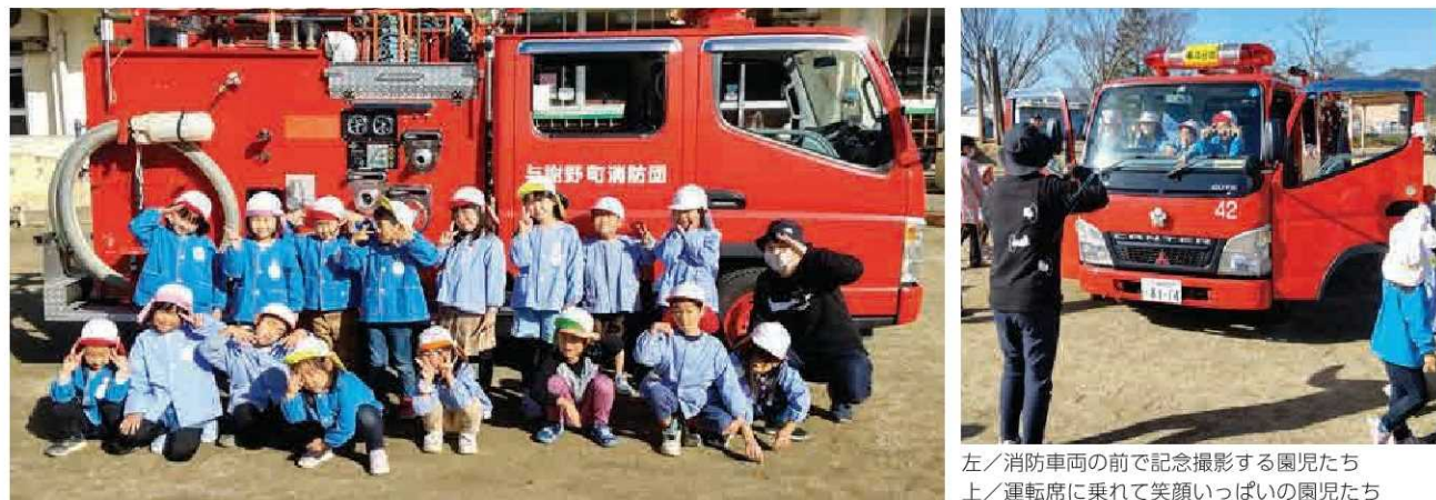
左/消防車前で記念撮影する園児たち 上/運転席に乗って笑顔いっぱいの園児たち