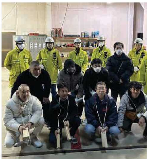
第4分団分団長OB会の皆さんと「火の用心」

また、令和5年年末警戒では、第4分団分団長OB会の皆さんと現役団員とが合同で、石川地域内の巡回（警戒）を行い連携を深めました。