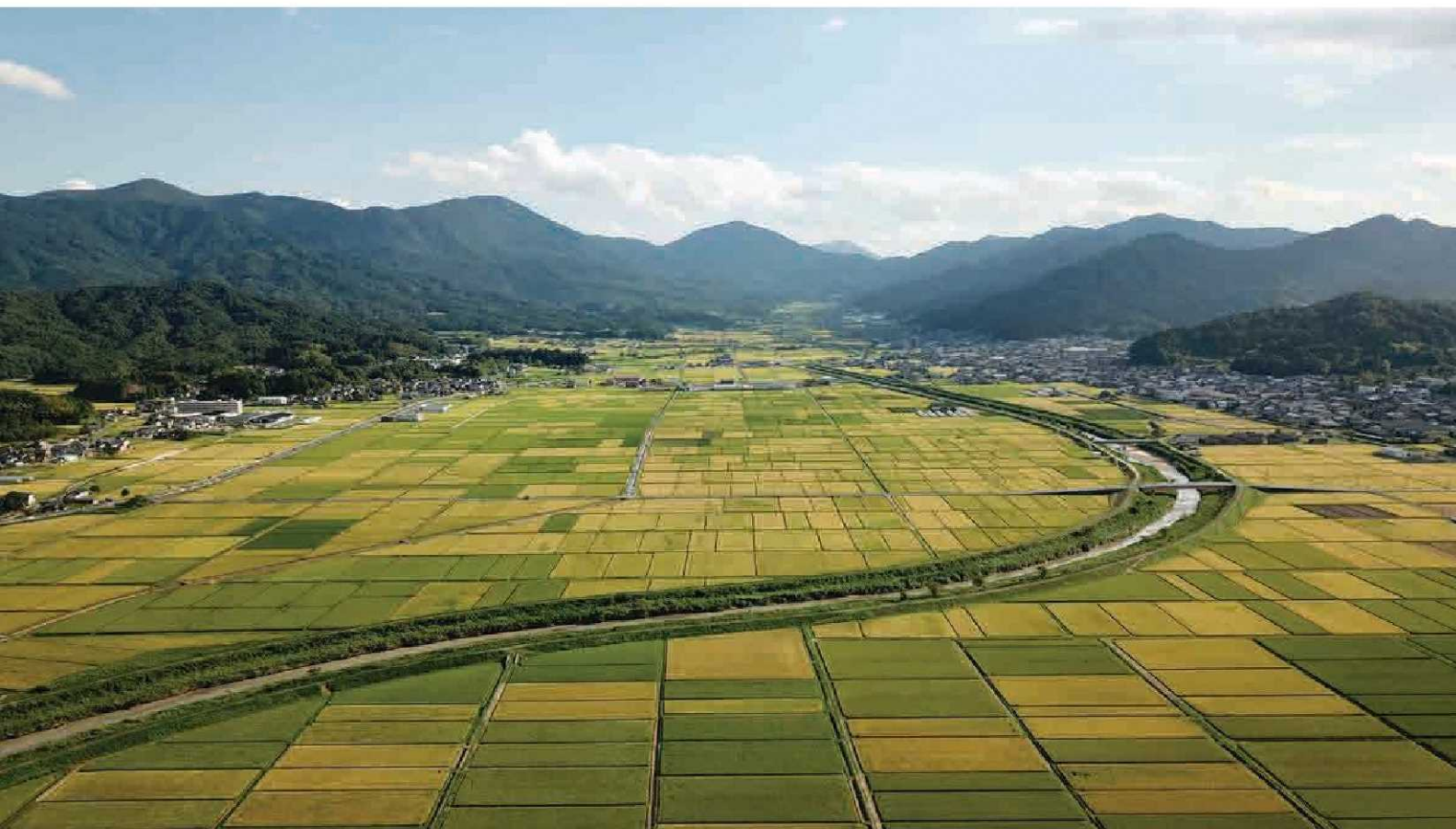
加悦谷平野に広がる田園風景。「山・川・海」と美しい自然を有する与謝野町。この景観を次代に継承していくためにも、森林の適正管理は必要です。