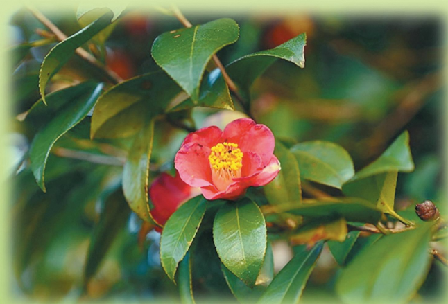
春の訪れを告げるツバキ