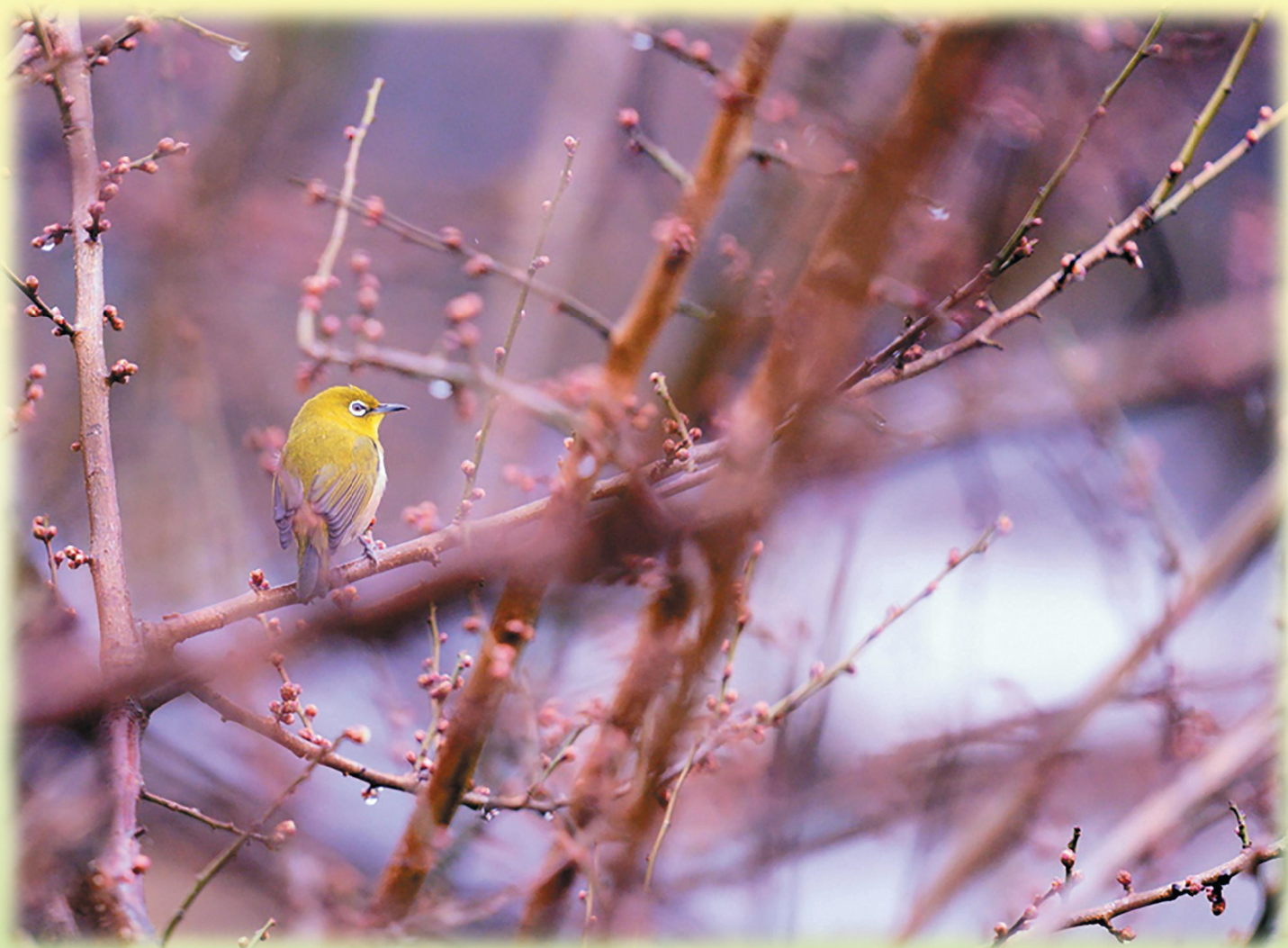
梅の木で休むメジロ