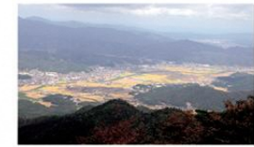
大江山から見下ろした与謝野町