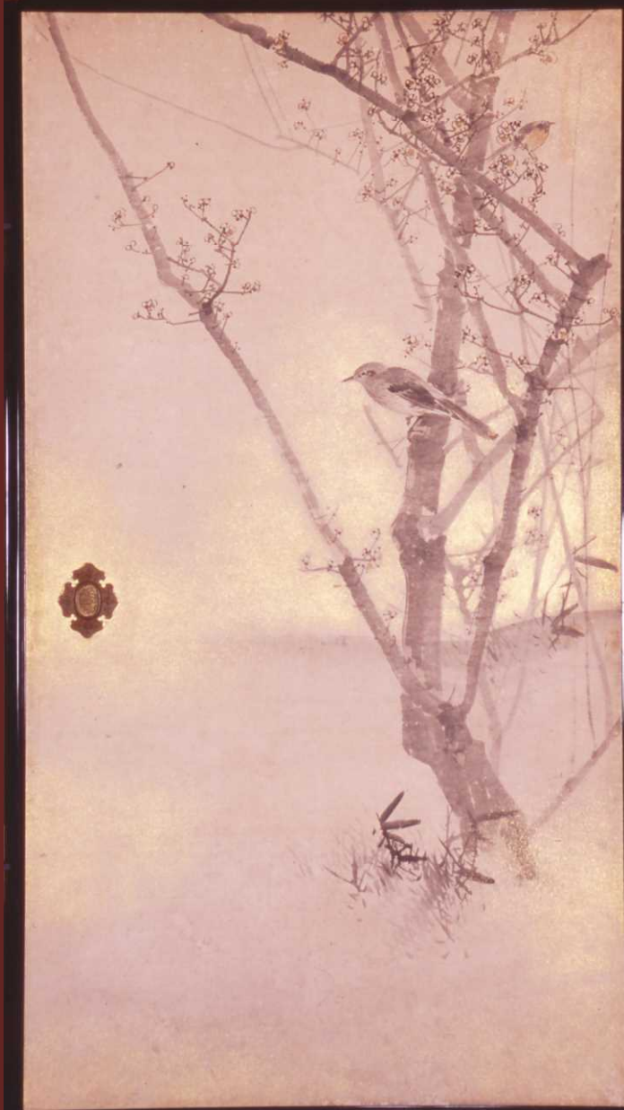
松村景文「白梅に小禽図」(襖四面/部分)